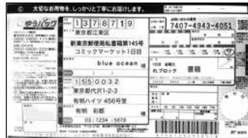
図2 宅配便伝票見本